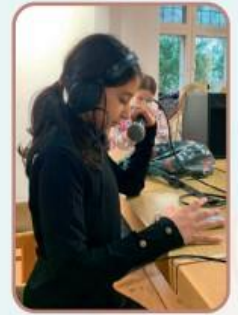
Jugendliche von 10 - 14 Jahren